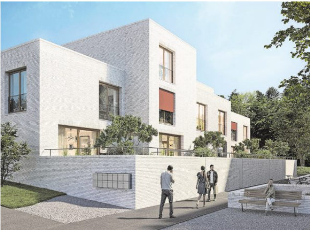
Die Überbauung zeigt sich als harmonisches Ensemble.