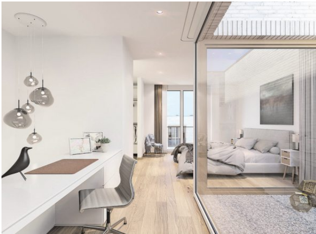
Im Inneren überzeugt sie mit hohem Wohnkomfort.