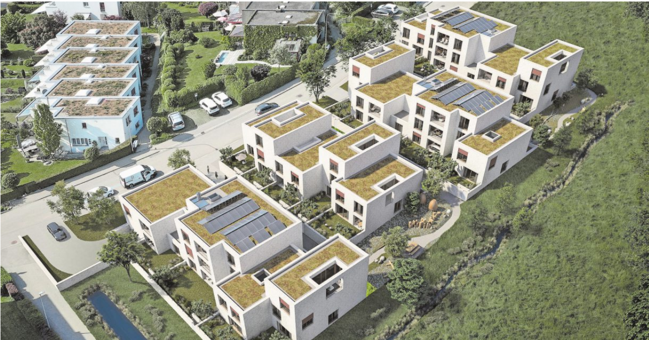
Eingebettet im Grünen: das neue Wohnquartier im Guggelen Park St. Gallen.

Mit dem Guggelen Park entsteht ein zeitgemässes, familienfreundliches Wohnquartier, das den Wohnraum am Stadtrand von St. Gallen auf nachhaltige Weise stärkt und das lebenswerte Quartier bestens ergänzt.